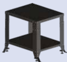
Table TAB-98 PRO / R Table de support ultra solide et parfaite pour les presses Sefa. Existe en version roulettes.